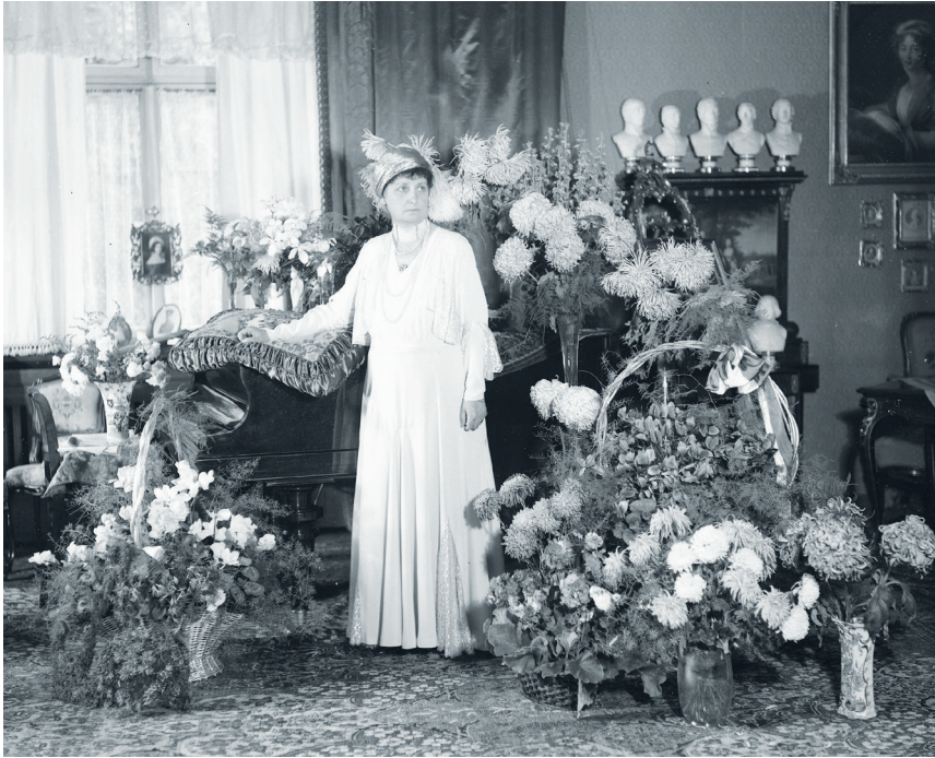
Prinzessin Maria Immaculata, Herzogin zu Sachsen

verboten wurde, gehörten bereits rund 250.000 Frauen zur Gemeinschaft des Werkes.